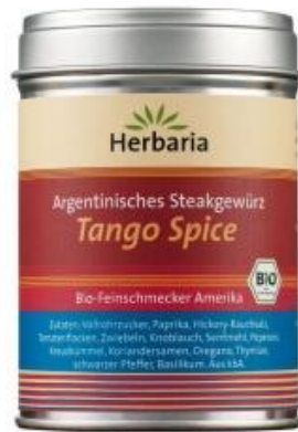
Herbaria Tango Spice, Argentinisches Steakgewürz Grundpreis: 11,95 €/100g, inkl. 7% MwSt. 11,95 €* ★★★★★ (1)