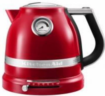
KitchenAid Wasserkocher ARTISAN empire rot 179,- €* ★★★★★ (5)