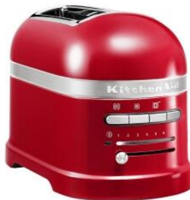
KitchenAid Toaster ARTISAN 2-Scheiben in empire red 249,- €* ★★★★★ (3)