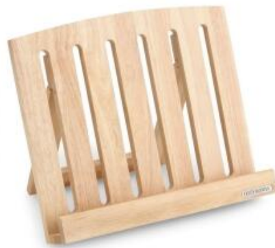
Continenta Kochbuchhalter aus Gummibaumholz