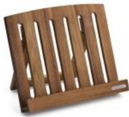
Continenta Kochbuchhalter aus Akazienholz